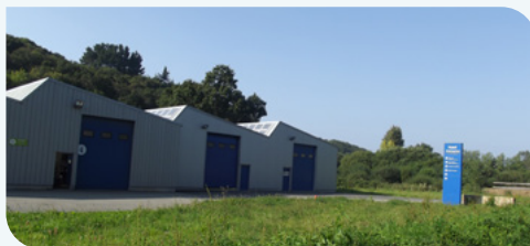
Des ateliers artisanaux au Ponthou, Plouigneau