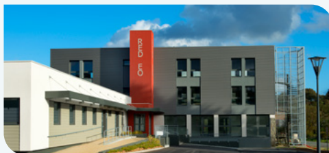
Des bureaux à Red Eo, Guerlesquin