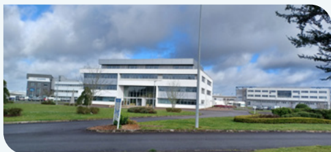
Des espaces dédiés à l'aéronautique à Morlaix