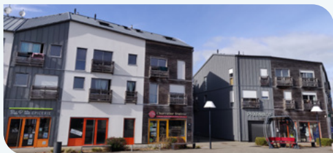
Des cellules commerciales à l'Espace Guével, Pleyber-Christ