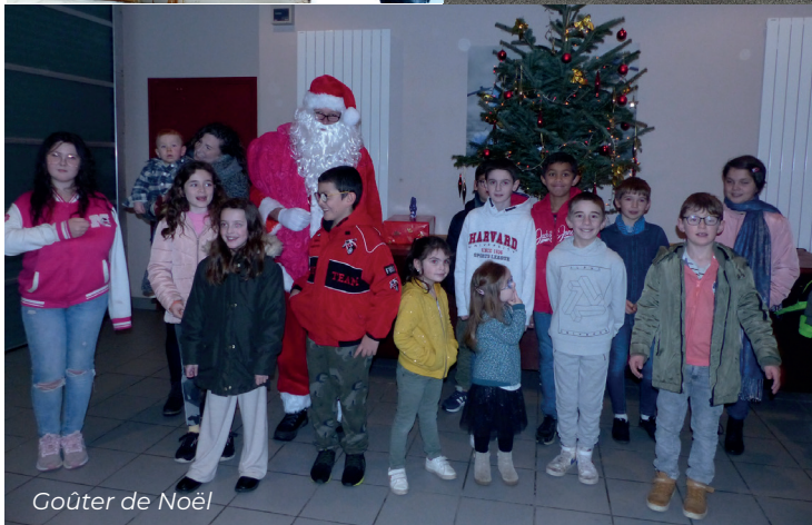
Goûter de Noël