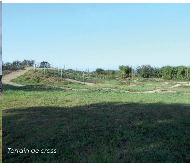
Terrain de cross