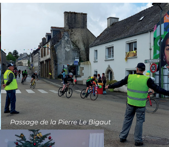
Passage de la Pierre Le Bigaut