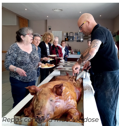
Repas conne la madovidose