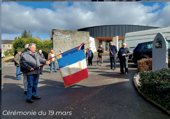
Cérémonie du 19 mars