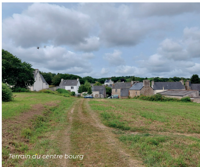
Terrain du centre bourg