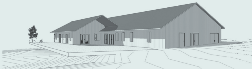
Vue sur jardin Ech. 1/50