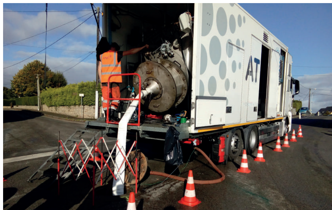
Réhabilitation par gainage rue de la Gare et rue de Bedernau

Depuis le 1 er janvier 2017, Morlaix Communauté a intégré la compétence de gestion de l'ensemble des services qui concernent la fourniture d'eau potable et le traitement des eaux usées. Le rôle de la collectivité est clair : gérer le prélèvement de l'eau dans le milieu naturel, la rendre potable, la distribuer, et, en aval, collecter, transporter et traiter les eaux usées ainsi que valoriser les boues produites.